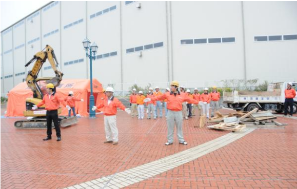
＜NPO法人泉大津自主防災会による道路啓開＞