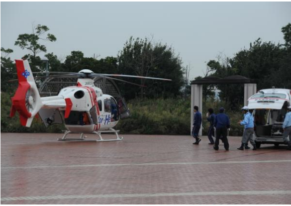
大阪府ドクターヘリ到着