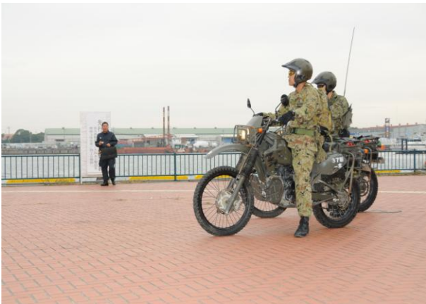
<自衛隊による調査偵察>