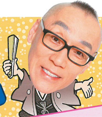
落語 桂小枝 (第1部出演)