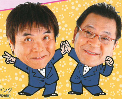
漫才 Wヤング (第1部出演)