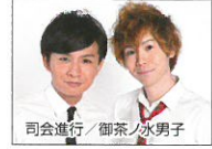
司会進行 / 御茶ノ水男子

●ハガキ、FAX、メールにて下記まで応募してください。 11月25日(金)まで(当日消印有効) 〒595-8686 泉大津市東雲町9-12 泉大津市教育委員会事務局 教育部生涯学習課「宝くじオーディション」係 FAX: 0725-33-0670 Eメール: syougaiakusyu@city.izumiotsu.osaka.jp 住所、氏名(フリガナ)、性別、年齢、電話番号を明記してください。 ※年齢・性別など一切制限はありません。 ※応募の際に提供いただいた個人情報、本イベントに伴うご連絡以外に利用することはありません。