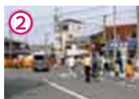
(2) 踏切。渡ったあと右(北)へ。