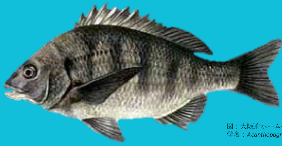
図：大阪府ホームページ「クロダイ」より 学名：Acanthopagrus schlegelii（スズメダイ科）

「ちぬ」の表記は、『古事記』・『日本書紀』に「茅渟」と記され、和泉国の古名です。そして、和泉国に面する湾を「茅渟海」と呼称しました。また、大阪湾で豊富にとれた黒鯛の別称ともなっています。